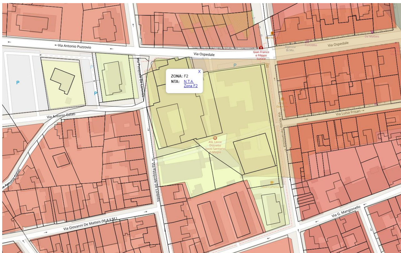
Figura 3: Stralcio del PRG vigente del comune di Maglie

Via Miglietta n. 5 - 73100 Lecce tel. +39 832 215767 email: gestec@ausl.le.it pec: area.gestionetecnica.asl.lecce@pec.rupar.puglia.it