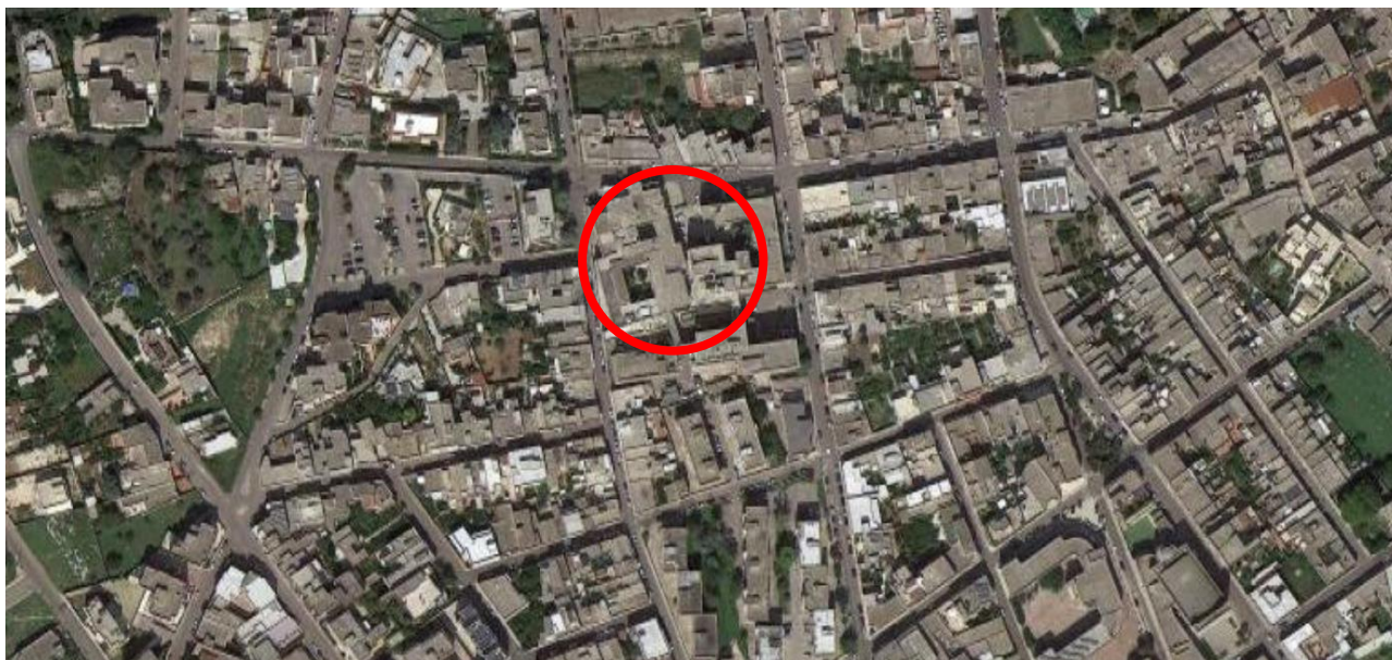
Figura 1: Aerofotogrammetrico Comune di Maglie con individuazione del PTA – Maglie

Il complesso sanitario è ubicato in zona occidentale del comune di Maglie (LE) ed è insediato su un'area di proprietà del SERVIZIO SANITARIO DELLA PUGLIA – AZIENDA SANITARIA LOCALE LE.