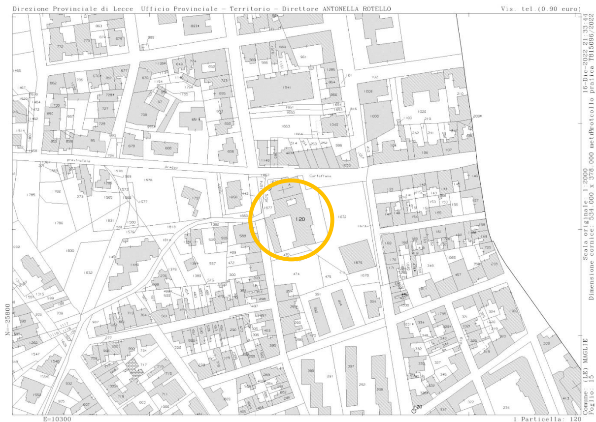
Figura 2: Estratto di scheda catastale

pec: area.gestionetecnica.asl.lecce@pec.rupar.puglia.it